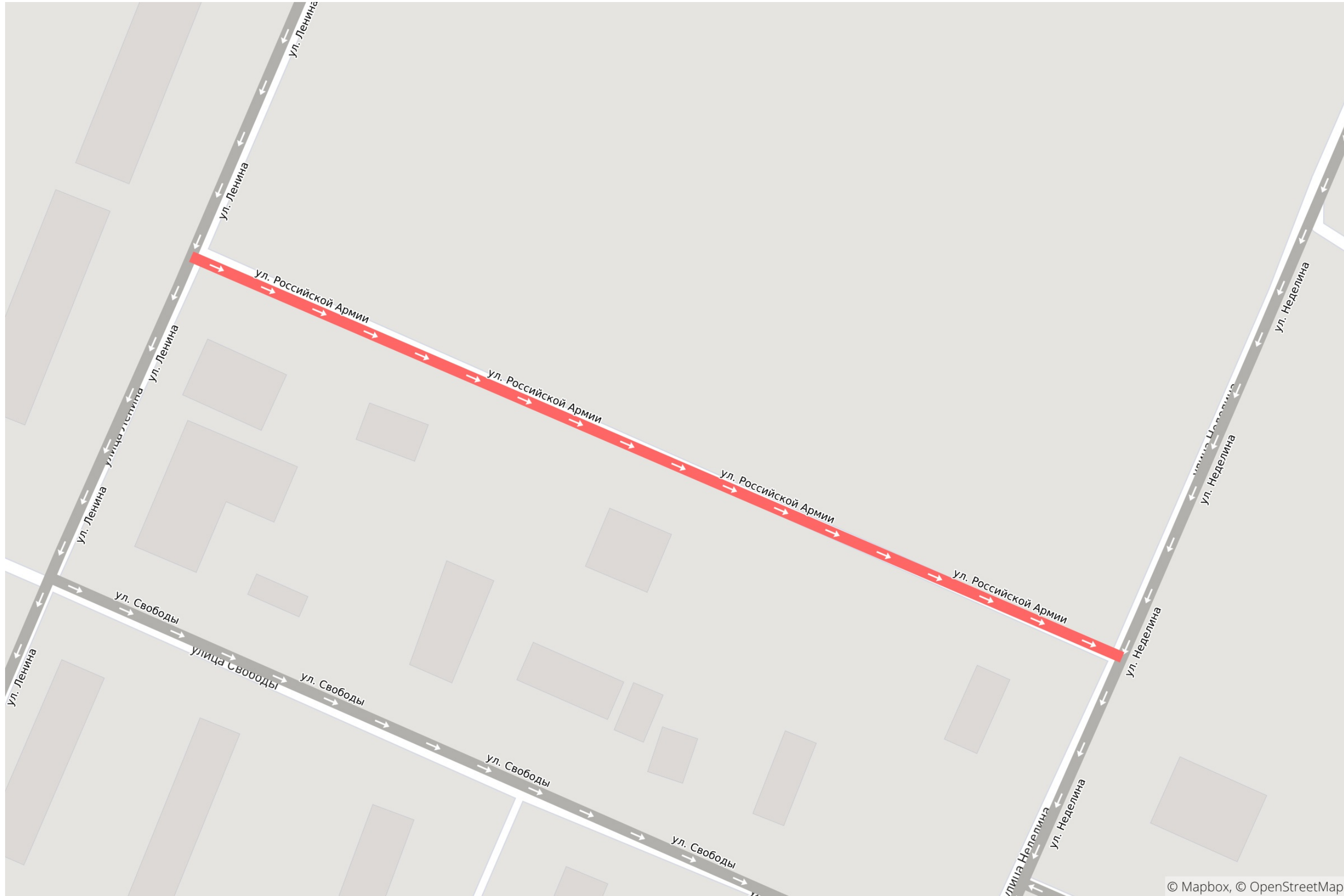
Схема расположения дороги: